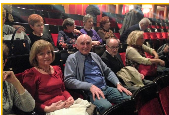
In posizione per assistere allo spettacolo