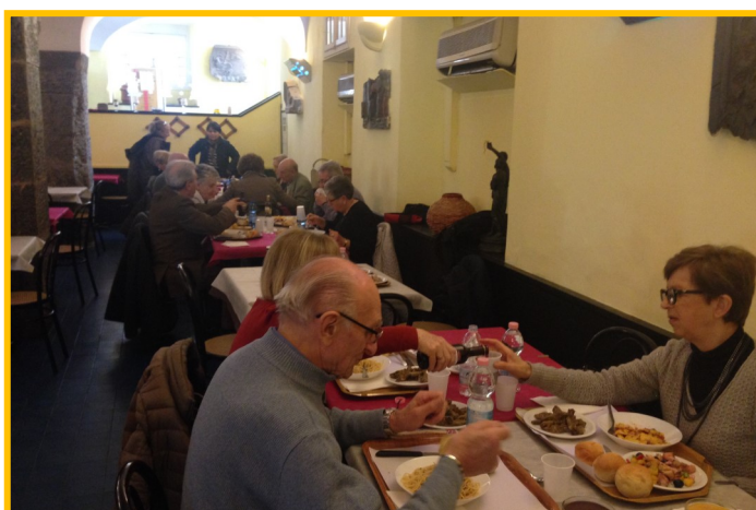
Abituale pranzo di mezzogiorno